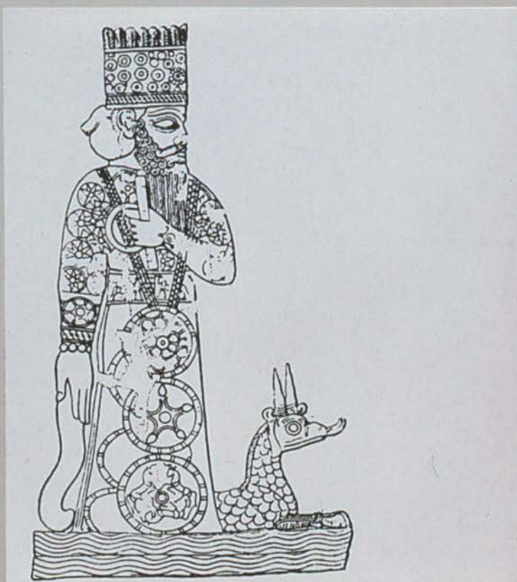
Abb. 2 Die Reliefwalze aus Lapislazuli (mit Umzeich- nung) zeigt Marduk, den Stadtgott von Babylon. Vorderasiatisches Museum, Staatliche Museen zu Berlin, Inventar-Nr.: VA B 646.