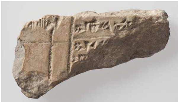
Figure 4: BS 365