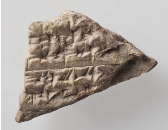
Figure 2: BS 363

1' mar-n ]u 2 - ṛ wa 2 -an 2 (-)x [ 2' NIN]DA.GUR 4 .RA- ṛ kán 2 [ 3' m ]ar-nu-wa-an(-)x [ 4' du-un-na-a ]k 2 -ke-eš-na(-)x [ 5' ]x-ta- ṛ ši 2 (-)iš 2 -[ 6' ] x x [