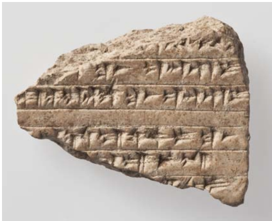
Figure 1: BS 362

lk. Kol. 1' -a]n 2 - r ti pē r -x[ 2' ] x TUŠ-aš GIŠ d INANNA.TUR 3' URU Zi]-ip-pa-la-an-da TUŠ-aš GIŠ d INANNA.TUR 4' ] 5' ] x r d n Ta-zu-wa-ši-i TUŠ-aš 6' U ]RU 2 Ka-ni-iš 7' ] x r MEŠ n -az